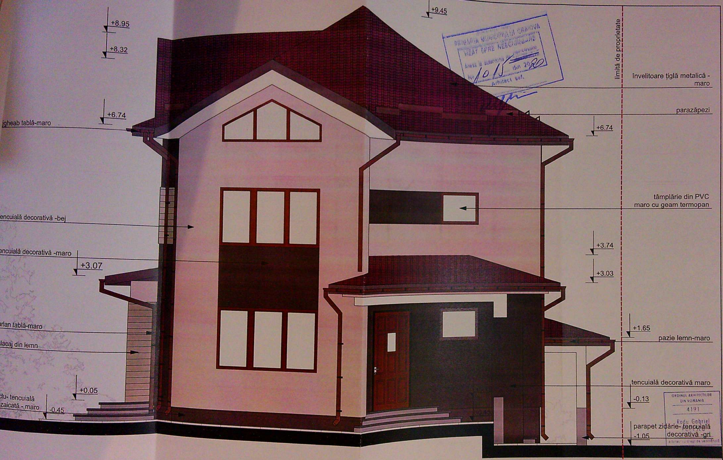
FATADĂ EST 1:50